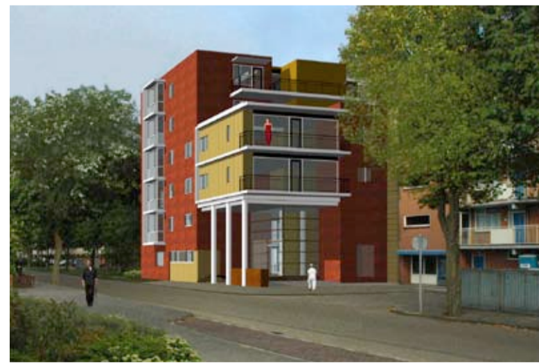
KLOUS + BRANDJES ARCHITECTEN BNA

Op de plek van de voormalige school de Duinroos (tussen de Flemingstraat en de Fahrenheitstraat) verrijst hier in de loop van 2009 het project De Duinroos. Een combinatie van woningen met op de begane grond een kinderdagverblijf. Het geheel bestaat uit een gebouw met zes appartementen (driehoog) en een complex met 57 appartementen. Op de begane grond van dit laatste gebouw krijgt Pluk van de Stichting Kinderdagverblijven Pippeloentje-Pluk (Skip) zijn nieuwe onderkomen, met aansluitend een mooie buiten-speelruimte. Onder dit gebouw komt verder nog een ondergrondse parkeergarage.